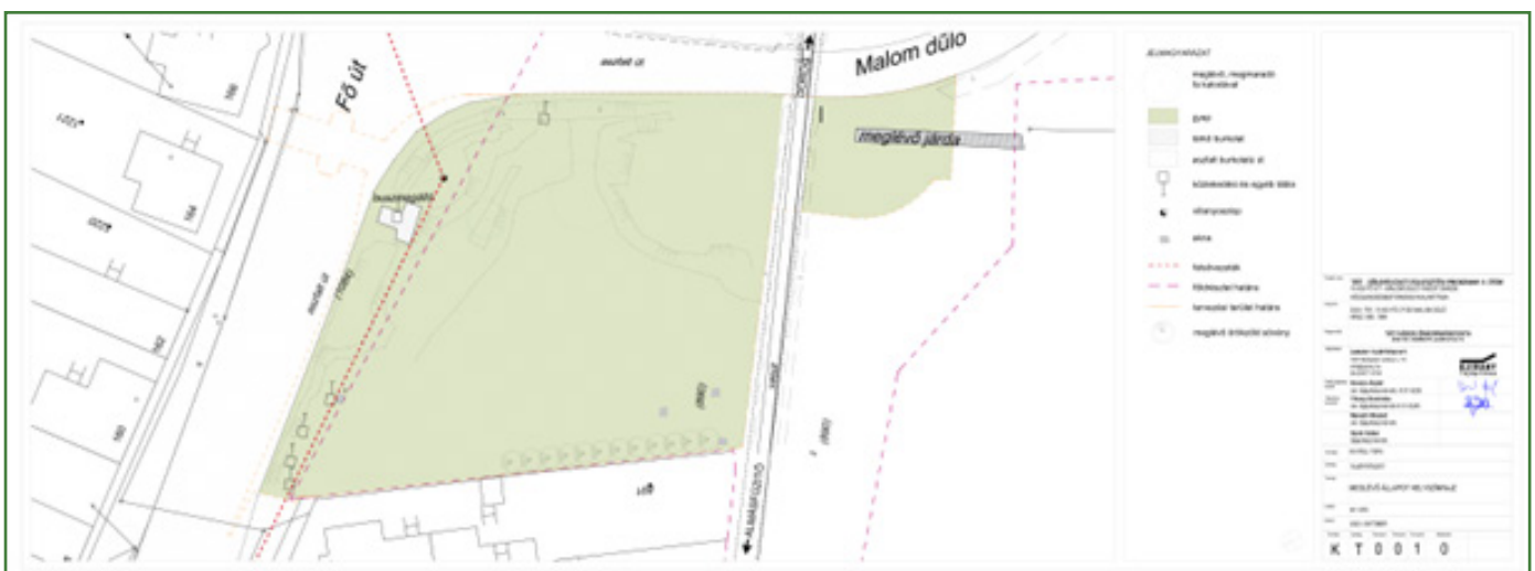
Meglévő állapot helyszínrajz – forrás: Új Irány Tájépítész Kft.