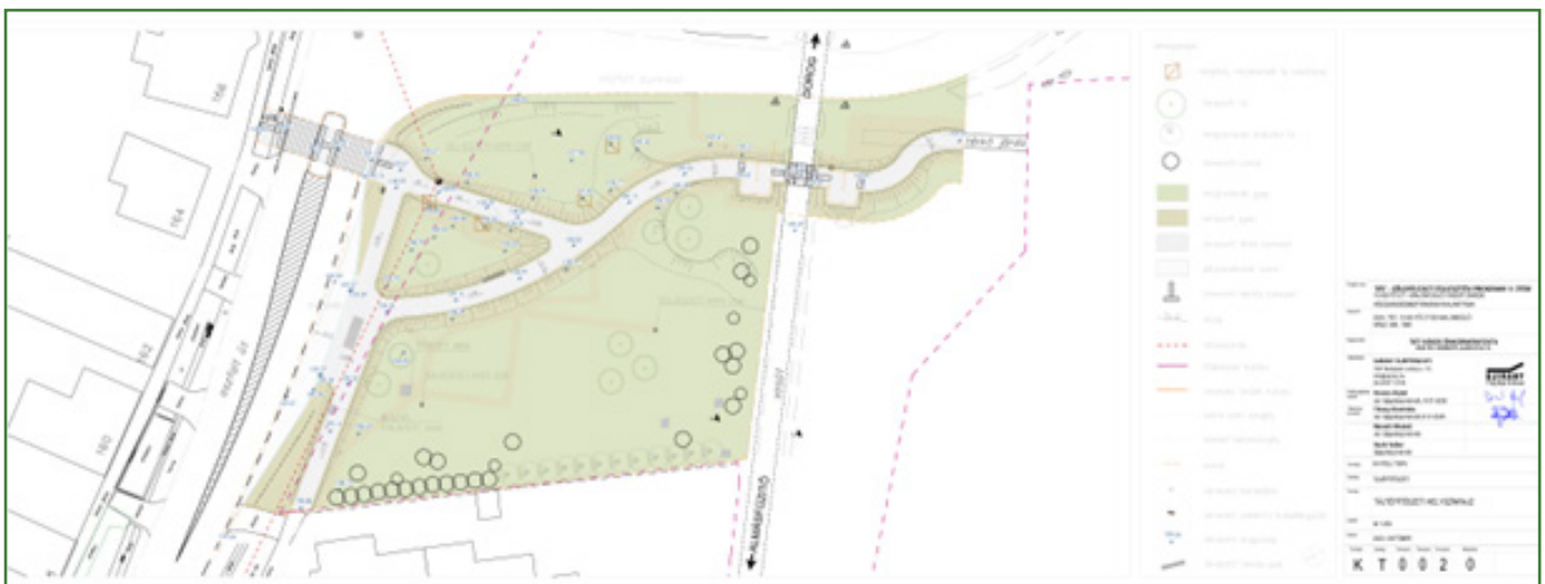
Tervezett fejlesztés helyszínrajz – forrás: Új Irány Tájépítész Kft.