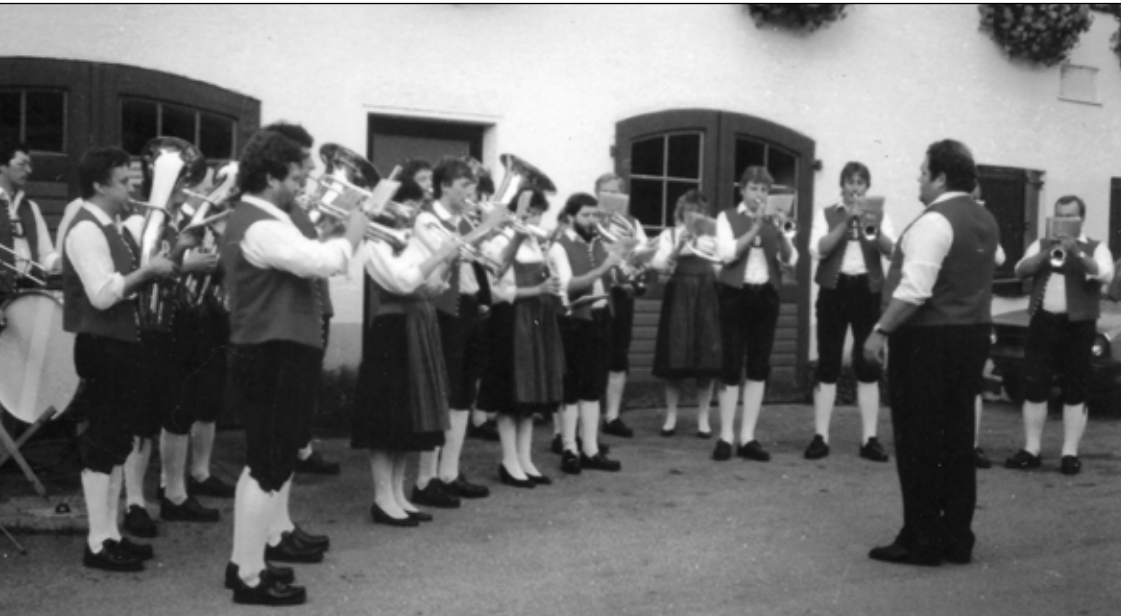
SCHRATTENBACHI FÚVÓSZENEKAR FOGADJA A TÁTIÁKAT (1986)