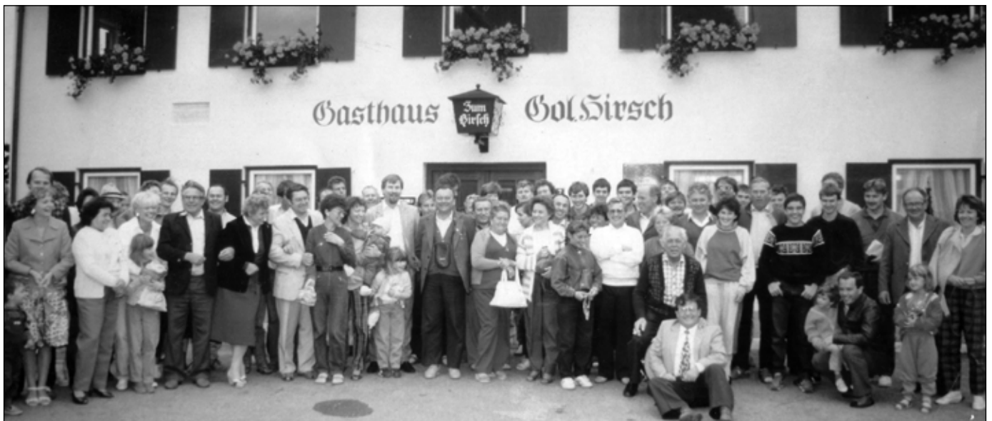
A BÚCSÚZÁS PILLANATAI HAZAUTAZÁS ELŐTT (1986)

A lefordított, hivatalos meghívólevél alapján kérvényezni kellett a Komárom megyei Tanács V.B. Művelődésiügyi Osztályán a Táti Német Nemzetiségi Fúvószenekar NSZK-ba történő utazásának a jóváhagyását. A kérvényünket