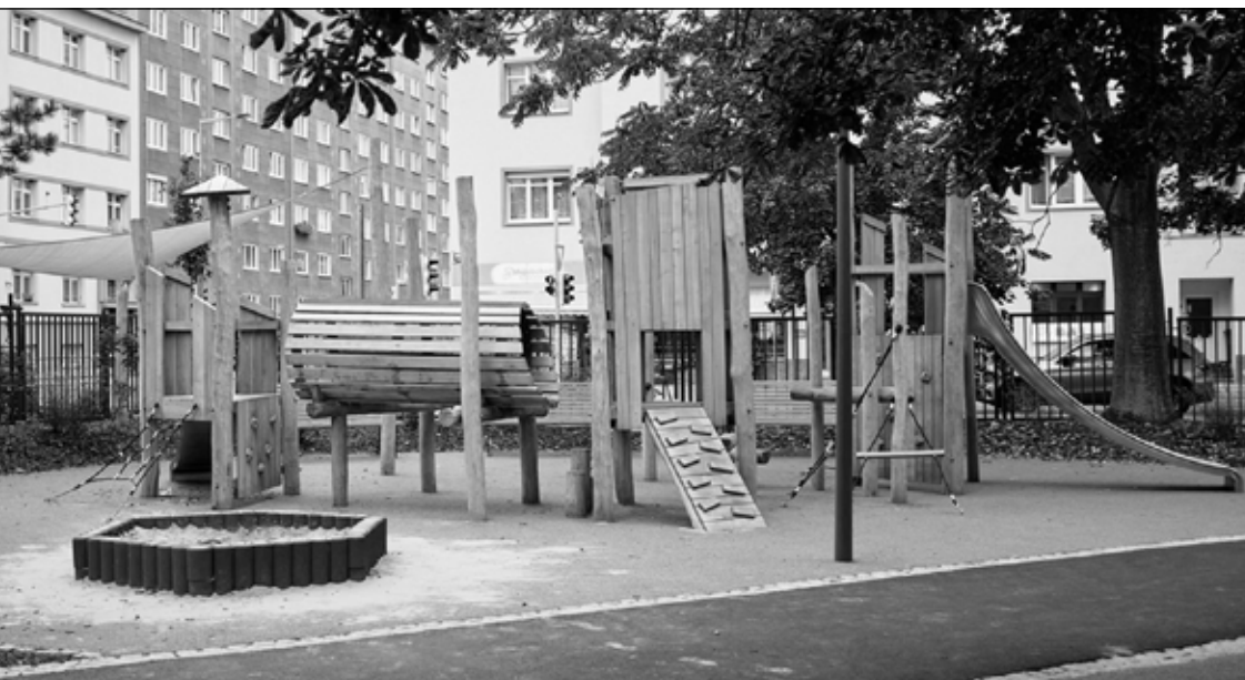
A KÉP ILLUSZTRÁCIÓ - A TELEPÍTENDŐ JÁTSZÓTÉRI ESZKÖZ EGY MÁR MEGVALÓSULT HELYSZÍEN.

Tát városa újabb fontos mérföldkőhöz érkezett a zöldterületek fejlesztésében: a Zöldhálózat Fejlesztési Program II. üteme a tervezettnél kedvezőbb költségek mellett valósult meg.