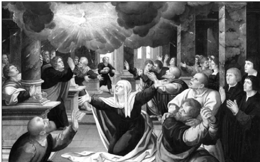
BERNARD VAN ORLEY KÖVETŐJE: PÜNKÖSD, 1530 KÖRÜL

Pünkösöd minden évben a szentlélek eljövetelére irányítja a figyelmünket. De ki is a Szentlélek?