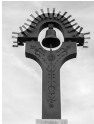
II. VH EMLÉKMŰ

Kedves Tátiak, kérem engedjék meg, hogy néhány gondolat erejéig bemutassam a Táti Helytörténeti Értékmentő Alapítvány munkáját, tevékenységét.