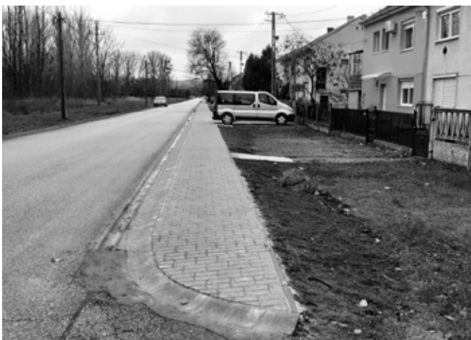
JÁRDA ÉPÍTÉS A GORKÍJ FASORBAN

A későbbiekben egy büfé működtetését is tervezük, melynek nyitását követően lehetőség lesz ugyanitt mobil nyugágyakat, további székeket és asztalokat, mobil tűzrakóhelyet igénybe venni, továbbá