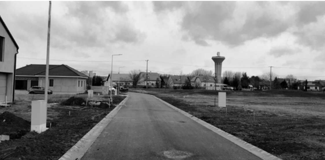
ÓRTORONY UTCA ASZFALTOZÁSA