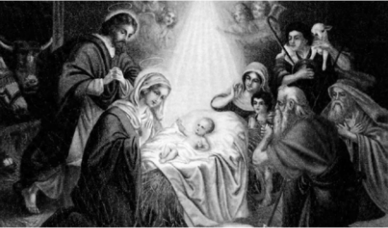
EBBINGHAUS VILMOS: KRISZTUS SZÜLETÉSE (1897)

Azt szoktuk mondani, hogy az ünnep attól lesz szép és tartalmas, ha készülünk rá. Ez igaz a családi ünnepekre és az egyházi ünnepekre egyaránt.