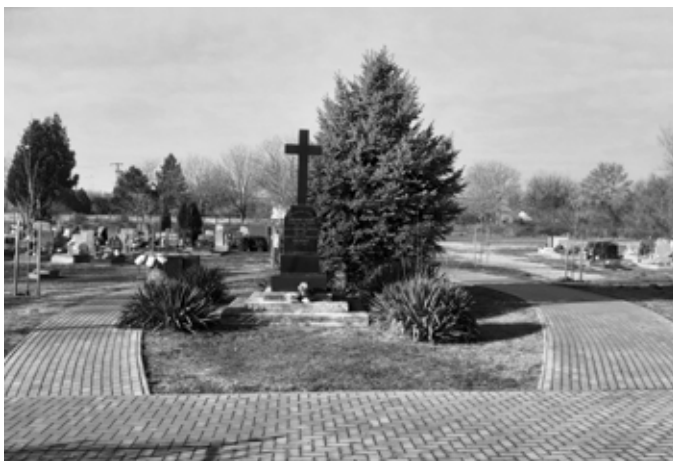
TEMETŐI SÉTÁNY KIÉPÍTÉSE