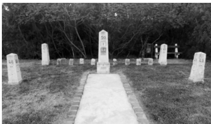
TÁTI VERSENPÁLYA EMLÉKMŰ