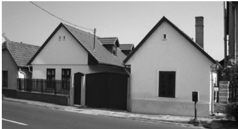
FALUMŰZEUM ÉS HELYTÖRTÉNETI GYŰJTEMÉNY