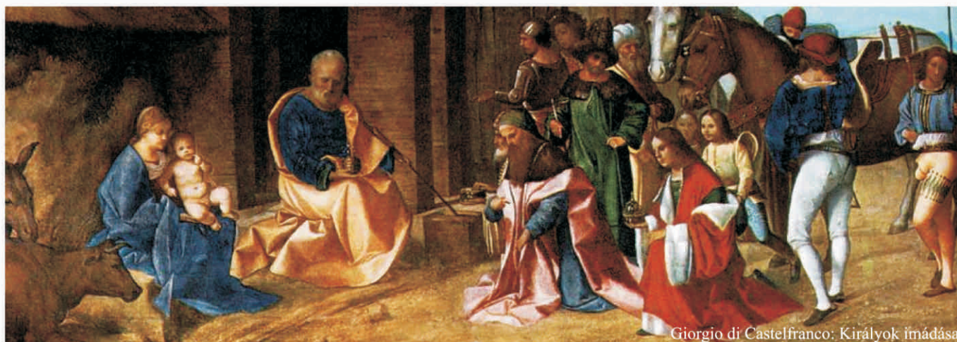
Giorgio di Castelfranco: Királyok imádása