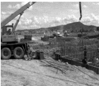
Unyi patak híd alapozás

A töltésépítéssel párhuzamosan, megkezdődött a műtárgyak építése is. A templomnál lévő Duna-parti kapcsolatot megteremtő aluljáró acélszerkezete készen áll, az árvízi biztonságát megteremtő megkerülő töltés is elkészült. Itt kétirányú rámpa épül majd a parti sáv és a földutak megközelíthetősége érdekében.