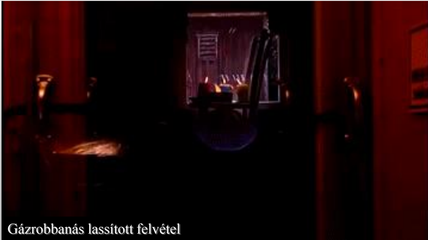
Gázrobbanás lassított felvétel

A vezetékes földgáz és PB gáz esetén is már kevés gáz elegendő a levegővel keveredve a robbanóképes keverékhez.