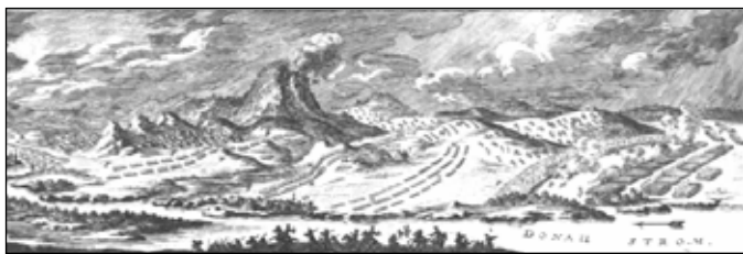
Korabeli metszet a táti csatáról (1704-ből). A kép a csatát az ebédidő domb felől örökíti meg.

1685 augusztus 16-án Tát és részben Tokod területén hatalmas hadseregek csaptak össze. A törökök 60 000 főnyi harcosa ütközött meg a 45 000-es keresztény sereggel (németek, osztrákok, lengyelek és magyarok).