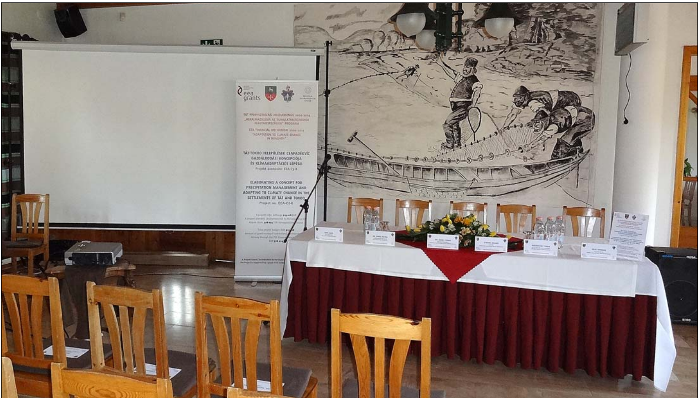
A rendezvény helyszíne

2534 Tát, Öreg Halász Hotel és Étterem, 2016. 03. 23. 11:00 óra